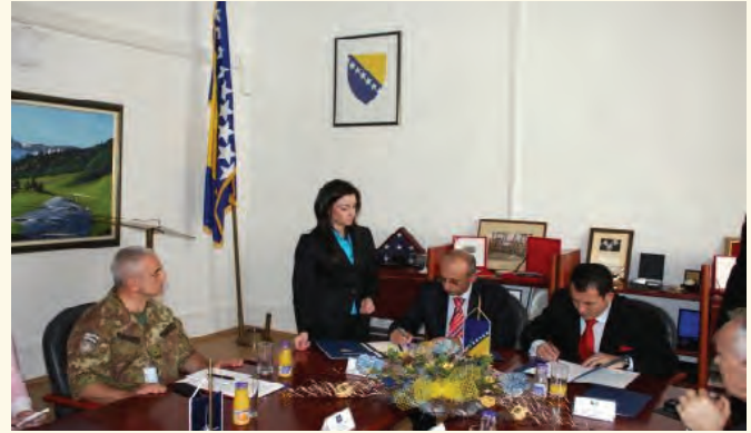
Потписивање Споразума, 29.06.2009.