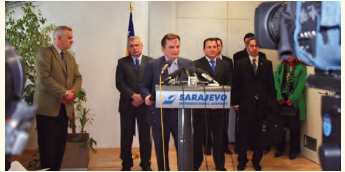
Пресс конференција чланова делегације БиХ по повратку са НАТО Самита у Букурешту, 4.4.2008.