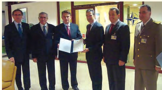
Предаја апликације, Брисел 02.10.2009.