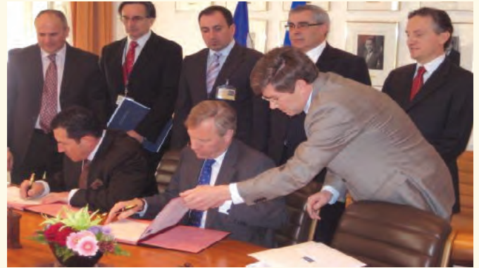
Потписивање споразума у Бриселу, 11.03.2009.