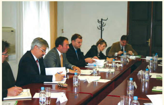
Сједница НАТО координацијског тима, предједава господин Игор Црнадак, 10.10. 2007