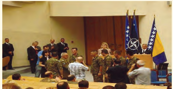
Уручивање сертификата СТАНАГ тиму ОС БиХ, 14. 07. 2009