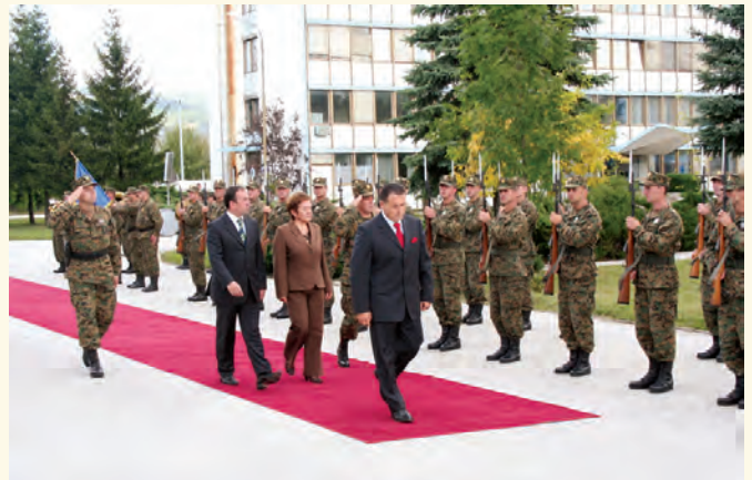
Церемонија поводом формирања Бригаде тактичке подршке, 12.9.2007.