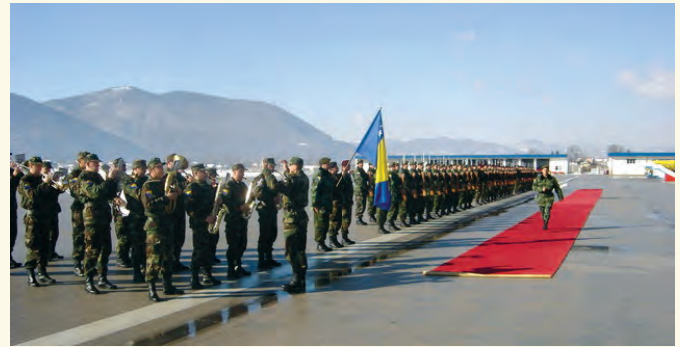
Прво представљање Почасне јединице ОС БиХ, 26.11.2004.