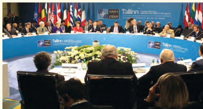
НАТО Самит у Талину (Естонија), 22-23.04.2010.