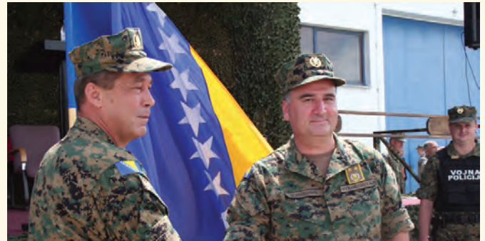
Церемонија поводом примопредаје дужности начелника ЗШ ОС БиХ, 21.7.2008.