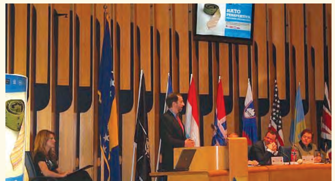
Парламентарна скупштина БиХ, 18.11.2010.