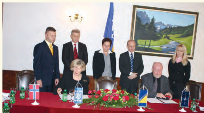
Потписивање протокола о ангажовању ИОМ-а у РТЦ, 28.10.2009.