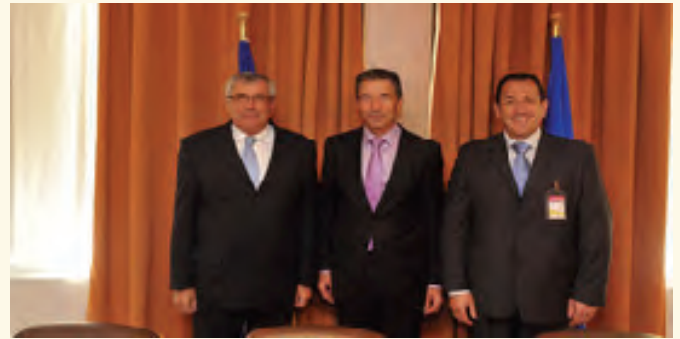
НАТО ХQ, Брисел, 14.07.2010.