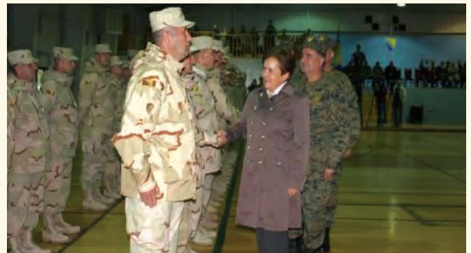
Церемонија испраћаја, војна база „Дубраве“, 15.10.2010.