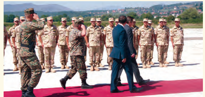
Церемонија испраћаја припадника I ротације Пјешадијске јединице у Ирак, 14.8.2008.