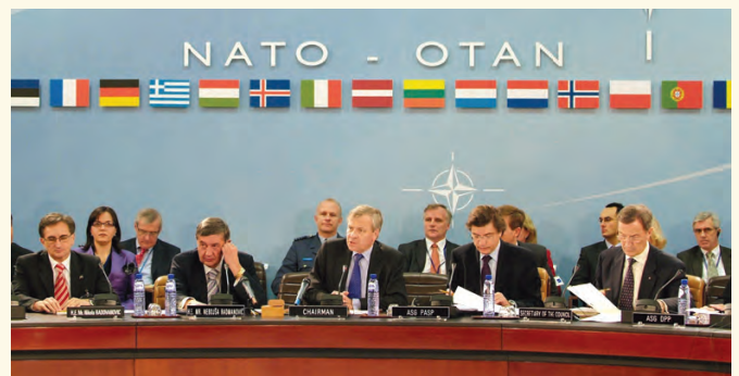
Церемонија потписивања Оквирног документа НАТО Програма ПфП у Бриселу, 14.12.2006.