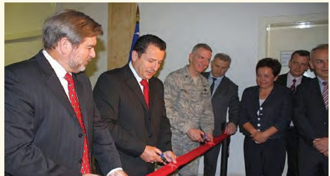
Церемонија отварања Оперативног центра, 05.08.2009