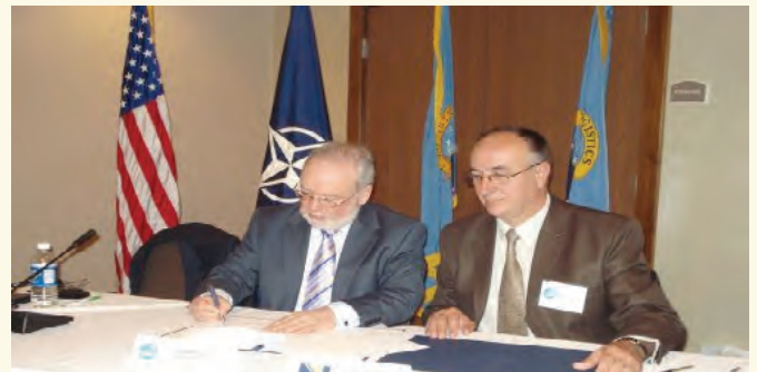
Потписивање Споразума, 14.05.2009.