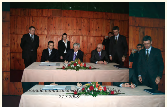
Церемонија потписивања Споразума у Добоју, 27.3.2008.