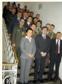
Сусрет првог Министра одбране и његових замјеника са представницима војно-дипломатског кора у БиХ, 15.12.2004.

USEUCOM - Joint Contact Team Program BK-04-38, UPOZNAVANJE SA ZAJEDNICKIM STABOM SAD 13-15 Juli 2004, Hotel "Italia", Sarajevo