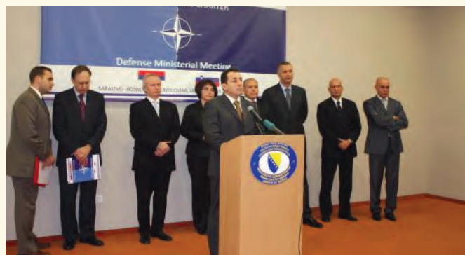
Министарски састанак А-5, 17-18.11.2009.