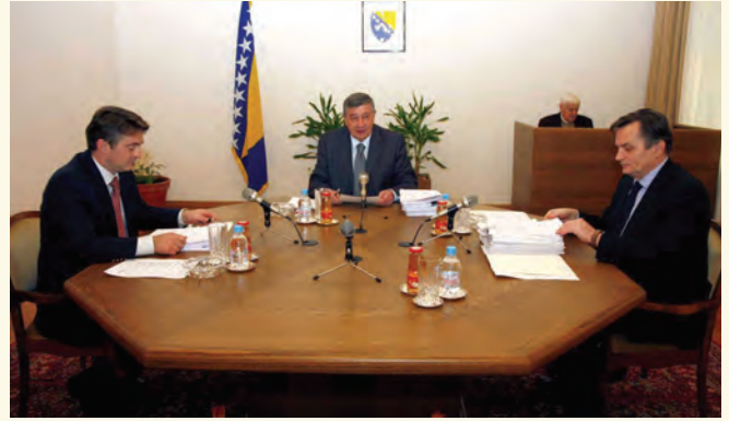
Сједница Предсједништва БиХ, 05.01.2009.