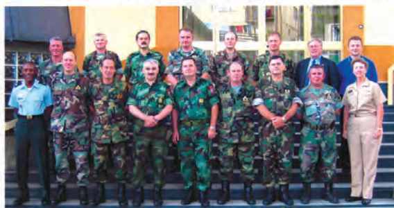
Сусрет представника УСЕУЦОМ са новоименованим генералима ОС БиХ, 13.7.2004.

USEUCOM - Joint Contact Team Program BK-04-38, UPOZNAVANJE SA ZAJEDNICKIM STABOM SAD 13-15 Juli 2004, Hotel "Italia", Sarajevo