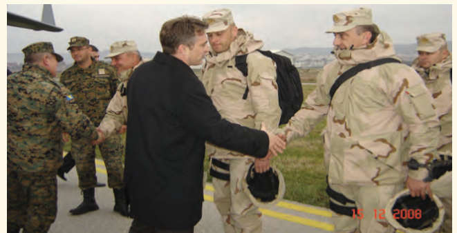
Свечани дочек поводом повратка 8. ротације Јединице за уништење НУС-а и 1. ротације Пјешадијске јединице, 15.12.2008.