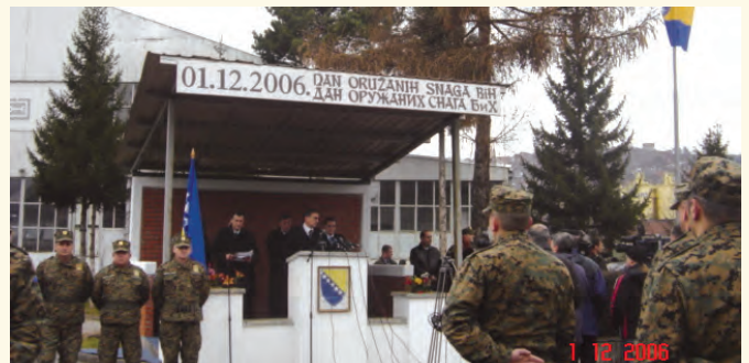
Обиљежавање Прве годишњице Дана ОС БиХ 01.12.2006.