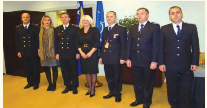
Мисија БиХ при НАТО- у у Бриселу