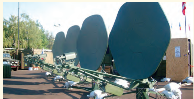
Сајт вјежбе „Здружени напор 2009“, касарна „Козара“, Бања Лука 04-17. 09. 2009.