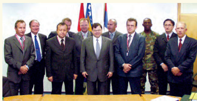
Састанак Комисије одржан крајем 2003. год.