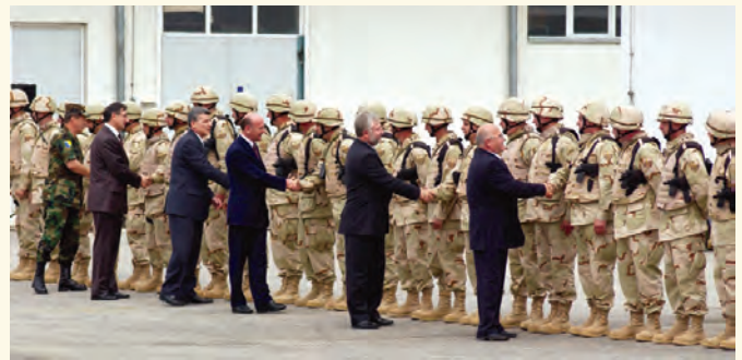
Церемонија испраћаја припадника I ротације Јединице за уништавање НУС-а у Ираку, 1.6.2005.