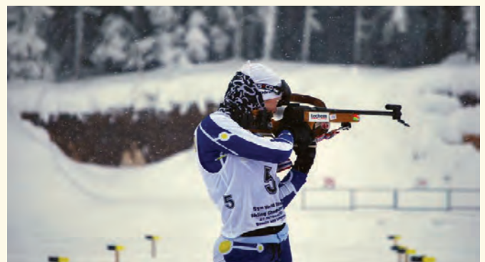
Олимпијске планине Јахорина, Игман, Бјелашница, 21-26.02.2011.